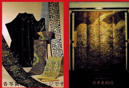
各写真、イメージです

創業110年の某老舗メーカー。江戸時代中期に、京都御所に出入りを許された禁裏御用達のメーカー。京都西陣の地に帯を中心とした絹織物製造の機屋さんです。現在も数千点の製造をしており全国各地の百貨店を中心に展示されております。そのモ/作りのなかで、「配色ミス」「ヤケ」「キス」などで+世の中に正規のルートで流通できない作品が、蔵で眠っています。その逸品を<KIMONOya ときわ>で